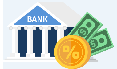
Por razón de inversión en depósito a plazo fijo en un banco.