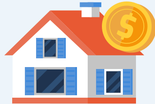
Por razón de inversión inmobiliaria mediante contrato de promesa de compraventa de bien inmueble.